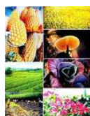
Medios de producción

El tipo de propiedad es el que determina en la forma de relación, distribución y consumo.